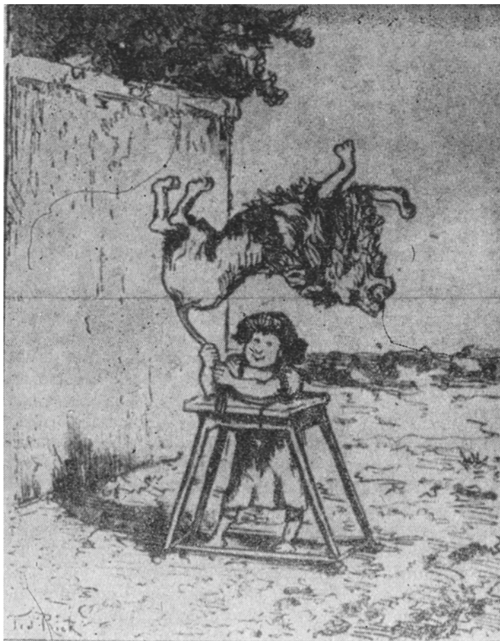
Samson copil omoară un leu

Încă din fragedă copilărie, băiețașul a dat dovadă de o forță supranaturală. Intr-un rînd, din pur amuzament, a ucis un leu care semăna groază în toată regiunea. Ajuns la maturitate, a hotărît să se însoare și, oricît de ciudat ar părea acest lucru pentru un ales al domnului, și-a exprimat dorința să ia de soție o filisteancă. Cît nu i-au amintit părinții că legea lui Moise oprește căsătoriile cu fete idolatre ! Samson o ținea pe-a lui, spunînd că fiecare regulă trebuie să aibă și o