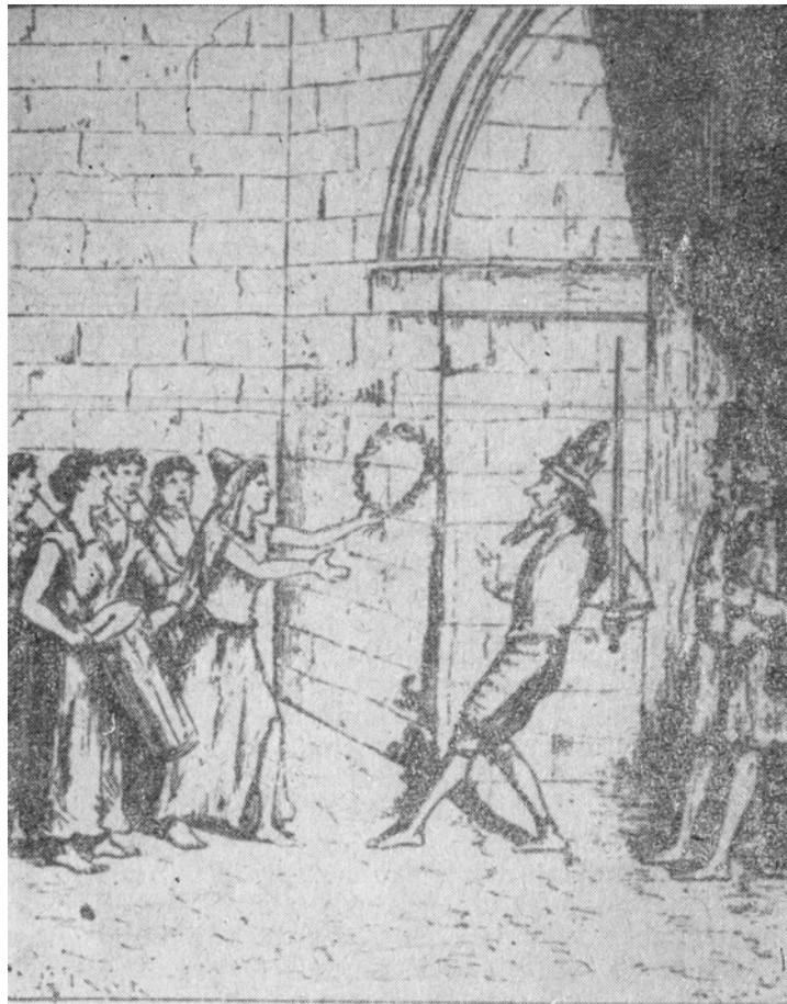
Fiica lui Ieftae iese în întâmpinarea tatălui ei victorios

Mițpa. Un cor de fete tinere, „cu chimvale și dănuind în horă”, a ieșit să salute pe biruitor, iar în fruntea fetelor se afla fiica iubită a lui Ieftae, care, bineînțeles, nu bănuia nimic despre juruință pe care o făcuse tatăl ei.