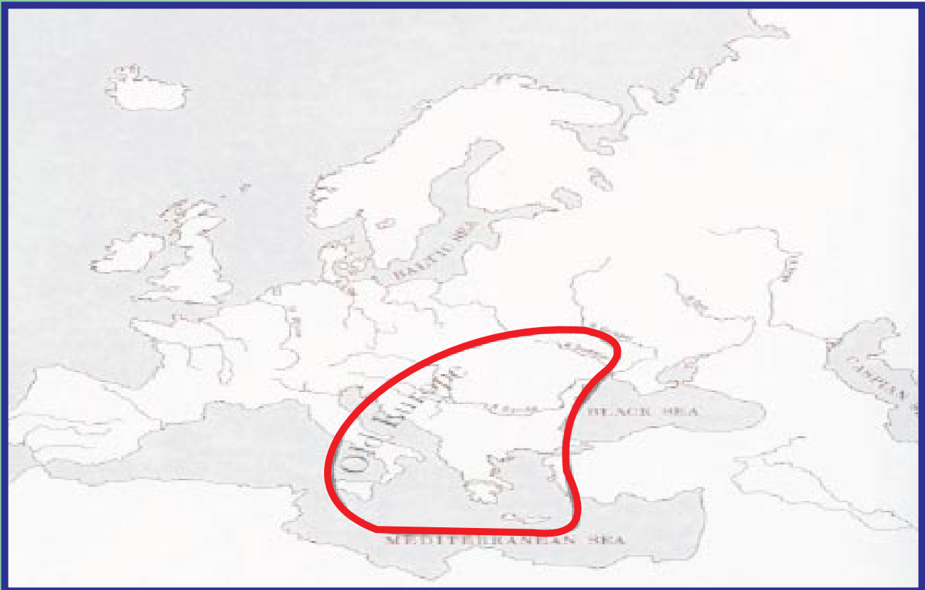
Map I: Old Europe: the area of autochthonous European civilization, c. 7000-3500 B.C. in relation to the rest of Europe

Astăzi această hartă a leagănului populației europene se predă la toate facultățile de istorie din lume