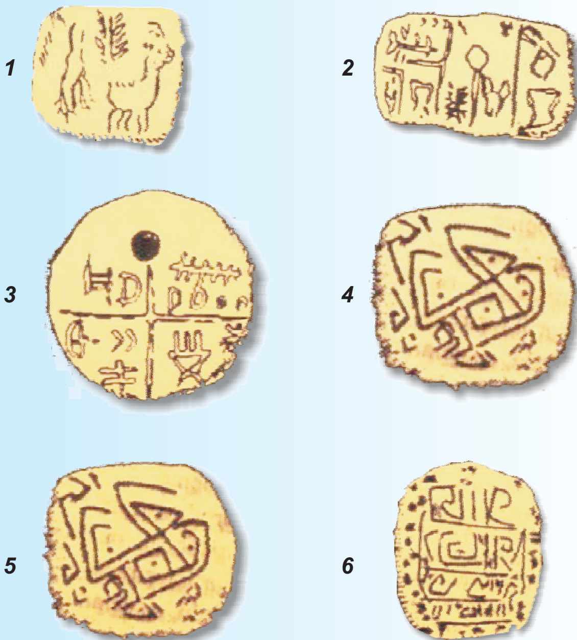
Fig. 5. PRIMUL MESAJ SCRIS DIN ISTORIA OMENIRII

1,2,3, Täblițele de la Tărtăria (cca. 5.300-5.200 î.d.H.) a căror descoperire în anul 1961 de către Nicolae Vlasa, a revoluționat concepția privind apariția scrisului, fiind considerate primul mesaj scris în istoria omenirii. Așadar, inventatorii scrierii „sumeriene“ au fost, oricât ar fi de paradoxal, nu sumerienii, ci locuitorii Transilvaniei, locuitorii spațiului Carpato-Dunărean și asta cu 1.000 de ani înaintea sumerienilor.